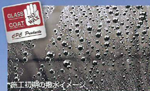
施工初期の撥水イメージ