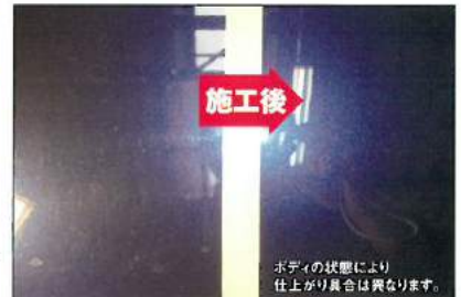
ボディの状態により仕上がり具合は異なります。

ボディに付着した汚れや鉄粉、小キズなどを除去し、表面を滑らかにした後に、新たなボディコーティングを施工し、美しさを守ります。 ※深いキズ等は完全に取れない場合があります。