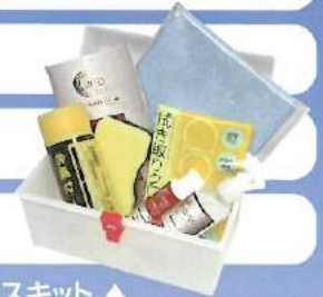
専用メンテナンスキット ▲