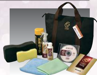
ガードコスメSP メンテナンスキット

普段のお手入れは水洗いでOKです。水洗いで落ちない汚れが付着したり、水弾き(撥水効果)が低下した場合は、アイテムを充実させたメンテナンスキットが効果を発揮します。